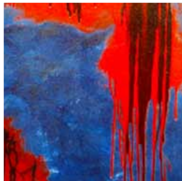
WILD 2007 TECNICA MISTA SU TELA 100X100 ESPOSTA ALLA GALLERIA ALBA DI FERRARA