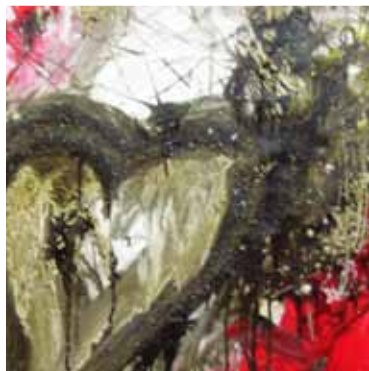
I LOVE YOU 2007 TECNICA MISTA SU TELA 75X75 ESPOSTA FONDAZIONE SELLA GALLERIA COLLEZIONE ROMA MEETINGART VERCELLI