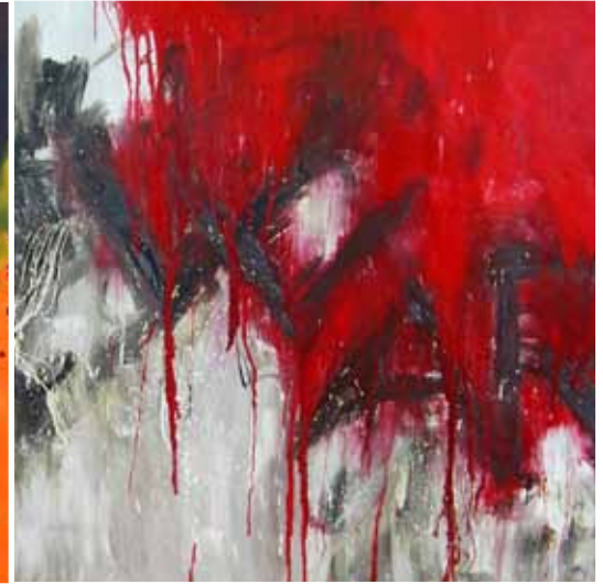
WAR 2007 TECNICA MISTA SU TELA 140 X100