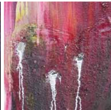
SENTIMENTAL STORM 2007 TECNICA MISTA SU TELA 75X75