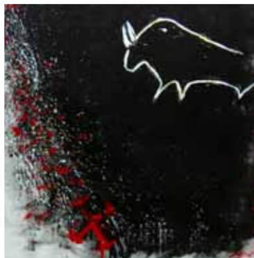
BUFALO 2007 TECNICA MISTA SU TELA 100X100 OPERA GEMELLA ACQUISTATA DAL SEATTLE MUSEUM