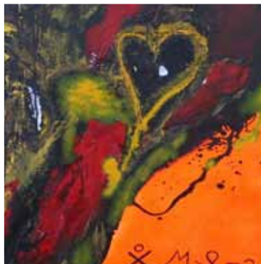
OMNIA 2007 TECNICA MISTA SU TELA 100X100 ESPOSTA FONDAZIONE BANCA SELLA GALLERIA COLLEZIONISTA DI ROMA MEETING ART VERCELLI GALLERIA VIADEIMERCATI VERCELLI