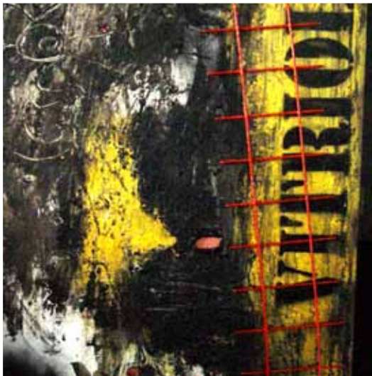
VITRIOL 2010 2010 TECNICA MISTA SU BANCALE