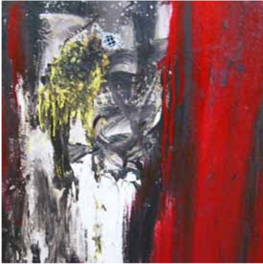
CRYING DAY 2007 TECNICA MISTA SU TELA 80 X 80