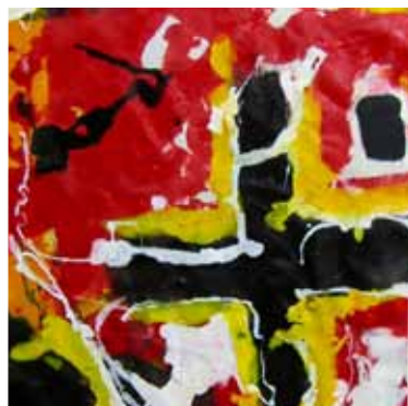
EUROPEA ORIGINE 2006 TECNICA MISTA SU TELA 20X120 ESPOSTA ALLA FONDAZIONE BANCA SELLA