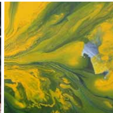
AI PRIMORDI 2007 TECNICA MISTA SU TELA 50X70