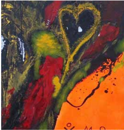
OMNIA 2007 2007 TECNICA MISTA SU TELA 75X 75