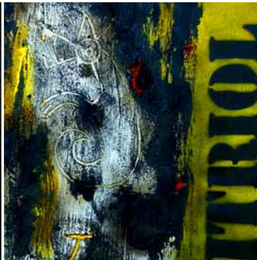
VITRIOL 2011 2011 TECNICA MISTA SU BANCALE