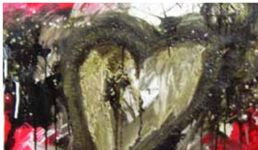
I LOVE YOU